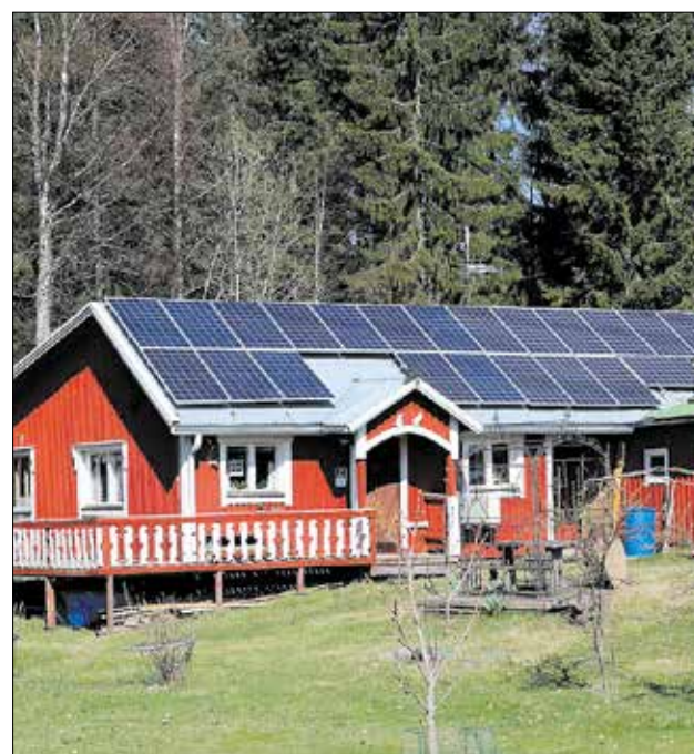
Sähköä voi tuottaa itekin, kuten tässä talossa.

Asikkalassa asuvan omakotitaloasujan vuosittaiset kus-