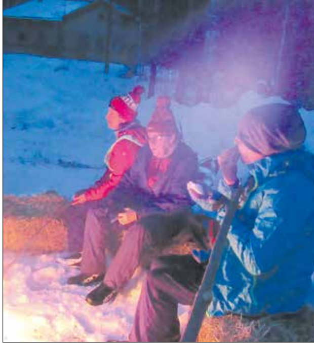
Kuu pysyi pilvipeitteen takana, mutta nuotio valaisi.

Visit Lahti osallistui messuille yhteisellä Järvi-Suomi-teemaisella osastolla Visit Jyväskylän Regionin kanssa. Yhteinen osasto nosti esiin Päijänteen merkityksen alueita yhdistävänä vetovoimatekijänä.