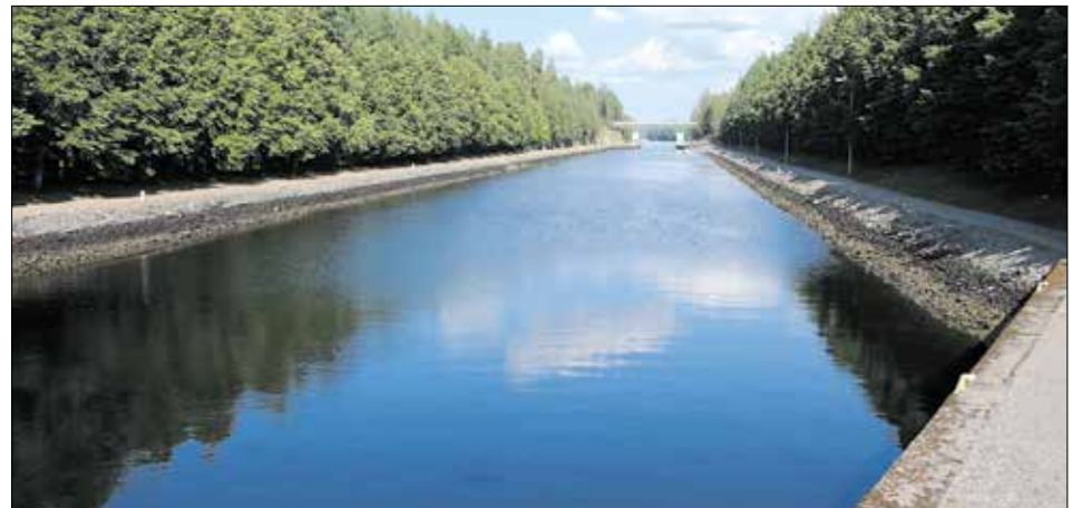
Kalkkisten kanavan 500 metrin sulku on Euroopan pisin makeanveden kanavien sulku. Lähes yhtä pitkiä sulkuja on Belgiassa ja Hollannissa.