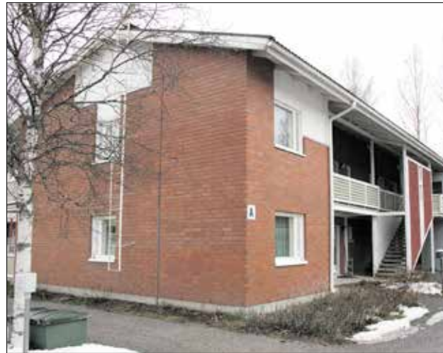
Kunnalle lahjoitetussa kiinteistössä on luhtitalo, rivitalo sekä niitä palveleva huoltorakennus. Asuntoja on 18.

”Erytiskiitos Hartolan Latu ry:lle ahkerasta tiedottamisesta, kannustamisesta hiihtokilometrien kirjaamiseen sekä kansallisen hiihtopäivän tapahtuman järjestämisestä”, internetsivulla mainitaan.